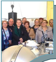
'Amigos de Madrid' en la sala del laboratorio

voluntariado, en el que participan investigadores de ciencias biomédicas y profesores de la Escuela Nacional de Sanidad. Se realizan visitas guiadas, con cita previa, para investigadores, profesionales, estudiantes y personas interesadas en conocer la historia de la sanidad pública en España.